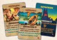
10 КАРТ ДЕЙСТВИЙ