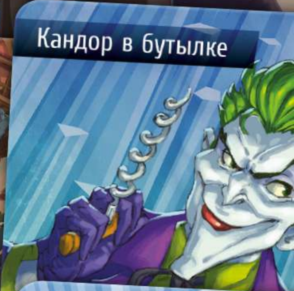
Кандор в бутылке