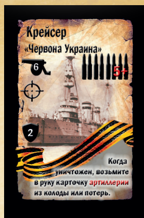
Рис.5 «Крейсер «Червона Украина»

«Минометы» является уникальной картой. По типу это отряд поддержки и из резерва карта должна выходить в соответствующее игровое поле. У отряда есть показатели атаки и точности, соответственно, находясь в поле «Поддержка», он может быть использован для проведения атак по отрядам противника находящимся во всех игровых ячейках, исключая поле «воздух». При этом на карте есть значок «улучшение пехоты», соответственно, она может быть прикреплена к пехотному отряду, что даст целевому отряду способность игнорировать защиту карт артиллерии и пехоты. Таким образом эта карта имеет сразу два способа использования на поле, в отличие от остальных карт не имеющих подобных возможностей.