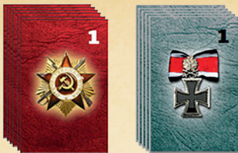
Рис 1. «Колоды хода»

Возьмите на руки пять карт из своей игровой колоды.